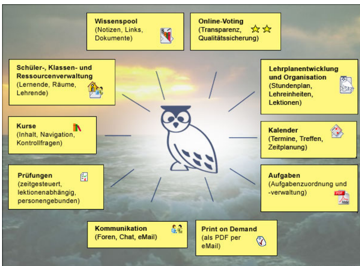
Funktionalitäten des LMS

Mit dem Learning Management System erstellte Kurse sind somit zukunftssicher, wieder verwendbar und vermarktungsfähig. Ein weiterer Vorteil besteht darin, dass Sie Präsenzunterricht mit Fernunterricht beliebig kombinieren und so Praxisunterricht mit eigenverantwortlichem eLearning sinnvoll verbinden