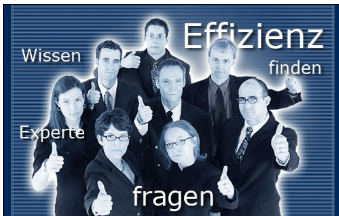
Abbildung 3: Selbstständige Weiterbildung

In einem Wissenspool liegen alle relevanten Informationen - aktuelle Entwicklungen, rechtliche Regelungen