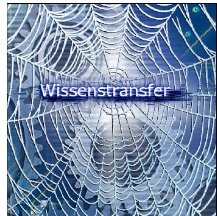
Abbildung 1: Vernetztes Wissen

Muss ein Personalleiter beispielsweise einen Vertrag mit einem osteuropäischen Arbeitnehmer abschließen und hat dies noch nie zuvor getan, kennt er sich nicht mit den rechtlichen Bestimmungen aus. Er könnte nun für diese einmalig benötigte Information an einer Schulung teilnehmen. Gibt es jedoch in absehbarer Zeit keine entsprechenden Termine, bleibt seine Frage vorerst unbeantwortet. Ist er aber Mitglied in einer entsprechenden Experten-Community für Personalleiter, erhält er von dieser sofort und verbindlich, qualitativ hochwertige Auskunft und mindestens einen Gesprächspartner hinsichtlich dessen, was er bei dem Vertrag beachten muss. Dabei agiert die Experten-Community ähnlich einer herkömmlichen Interessengemeinschaft (Community) im Internet. Personen, welche die gleichen Themen bearbeiten, stehen, je nach Bedarf, in regelmäßigem oder unregelmäßigem Austausch miteinander. Der Schulungsleiter von heute ist nicht mehr für das mehrfache Halten sich wiederholender Schulungseinheiten verantwortlich, sondern er ist Voll- oder Teilzeit Experte, Coach, Lektor, Moderator und Koordinator in der Experten-Community seines Kompetenzbereiches.